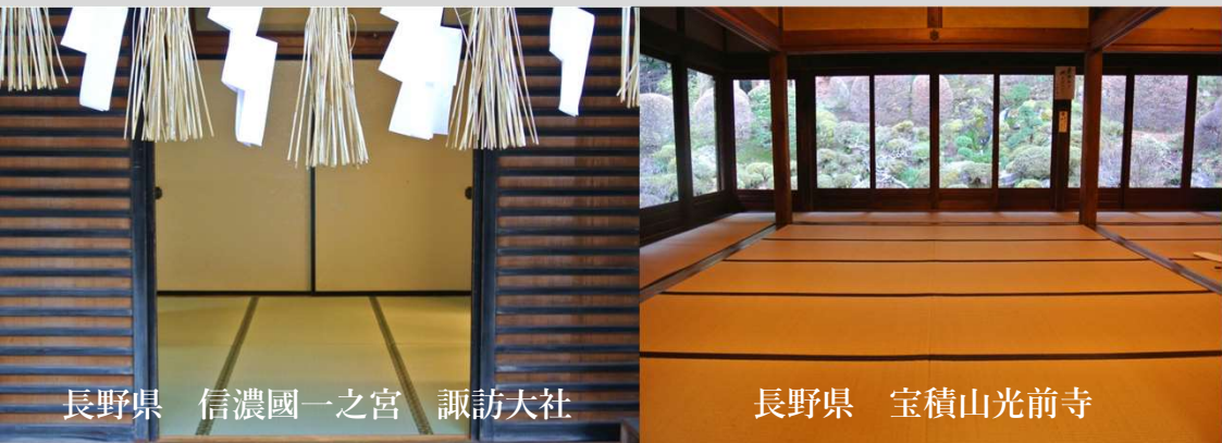
長野県 信濃國一之宮 諏訪大社