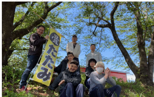
アンサンブル会 ものづくり班

当法人は平成13年11月に設立され、翌年通所授産施設「ワーキングスタジオアンサンブル」(定員20名)が松川町に誕生しました。もともと障害のある子を授かった親の取り組みは、令和6年現在210名規模になりました。市場で評価される様々な自主製品を生産販売しています。これは労働を通じた社会参加であり、重度の障害のある方も参加できるように工夫することが私たちの就労支援です。