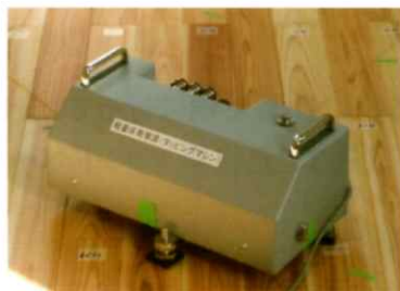
タッピングマシン