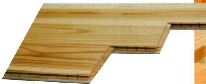
無垢材【杉/檜】(10.0mm) 防音材(4.5mm)